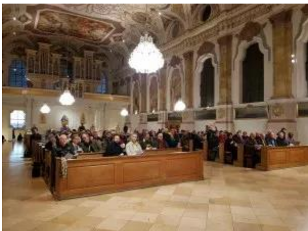
Romana en su conjunto.

En todo este proceso de descubrimiento, la comunidad es vital. Me encanta la forma en que las comunidades del arcoíris celebran la vida y el amor en medio de la violencia y la humillación, sin negar el dolor, pero sin olvidar los regalos que se nos han otorgado. Estamos aquí trabajando, celebrando, orando, discutiendo, compartiendo alegrías y preocupaciones, y divirtiéndonos en un lugar seguro. A veces, incluso escuchándonos cuando hablamos. Nos fortalecemos con nuestra presencia, damos nuevas esperanzas. Podemos sentir que la promesa de advenimiento se está convirtiendo en realidad. El Viviente está justo en medio de nosotros. De esta manera, somos iglesia, siguiendo las enseñanzas de Jesús, mientras todavía esperamos que la promesa de advenimiento se vuelva real para nosotros en la Iglesia Católica