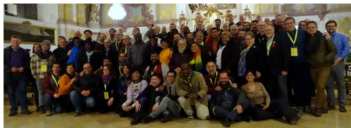
Segunda Asamblea de la Red Global de Católicos Arcoíris

La Segunda Asamblea de la GNRC – 30 de noviembre al 3 de diciembre del 2017 – ya ha concluido y un asombroso legado para la Red Global de Católicos Arcoíris permanecerá. Esta fue una oportunidad maravillosa para fortalecer los lazos entre nuestros miembros, como también para tomar también decisiones importantes como una comunidad unida. Desde ahora, todos nosotros, en la GNRC proclamamos “Atiende a nuestro Clamor” (Salmo, 17, 1).