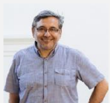
Padre Pedro Labrin SJ del Cile