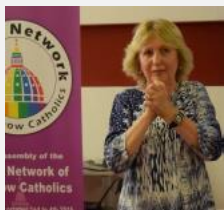
Mary McAleese dall'Irlanda